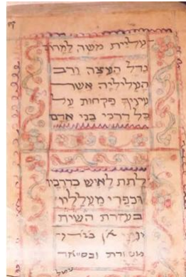
דסתפ שלמה בצלאל