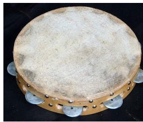
דויירה (Doyreh, Doyrah)