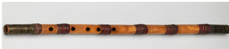
חליל קנה פרסי מהמאה ה-19 במוזיאון מטרופוליטן, ניו-יורק

המוסיקה הקלאסית באזורים אלה מבוססת על סולמות המשלבים מנגינות מאולתרות ומובנות: ה"ששמקאם" (Shashmaqam - ששת המקאמים): המרכיב המרכזי במוסיקה של בוכרה (אוזבקיסטן וטג'יקיסטן ככלל). זוהי מערכת הכוללת קטעי נגינה ושירה, המבוססים על שירה פרסית קלאסית. היא מבוססת על סדרת מנגינות קבועות (רדיף-Radif) המשמשות בסיס לאלתור רגשי ומעמיק. מדובר באוסף של מאות קטעים מוזיקליים קצרים. בשנת 2009 הוכר ה-רדיף על ידי אונסק"ו כמורשת תרבותית בלתי מוחשית של האנושות. קיימת זהות כמעט מוחלטת בכלי הנגינה שבהן ניגנו יהודי המרחב, עם שינויים קלים בשמות ובמבנה: דותאר (Dutar - דו מיתרי) נפוץ בכל האזור, לצד תאר (Tar), הסיתאר (Setar) והרובב (Rubab) האפגני האייקוני. הקמנצ'ה (Kamancheh) כינור ברוך בעל צליל מתרפק ונוגע ללב, המשתלב באופן מושלם עם קולו של הזמרת. והגיצי'אק (Ghichak) במרכז אסיה ואפגניסטן. נאי (Ney): חליל קנה סופי, המייצג לפי רומי את האדם המקונן על פרידתו מהמקור האלוהי. דויירה (Doyra / Doireh) – 'תוף מרים' גדול, הכולל לעתים טבעות מתכת פנימיות – הקצב של התוף מייצג את 'פעילות הלב' של האוהב (הסופי), המשתוקק להתאחד עם האל. צליל התוף קורא לאדם להשתחרר מהדאגות הגשמיות, לסובב את ראשו במחול ולהתמסר לאהבה האלוהית.